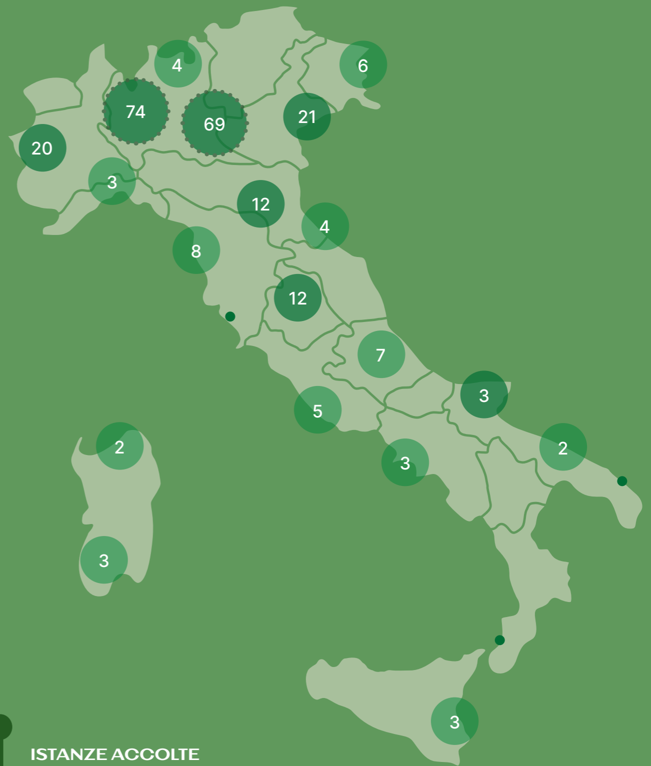
ISTANZE ACCOLTE NEL 2023