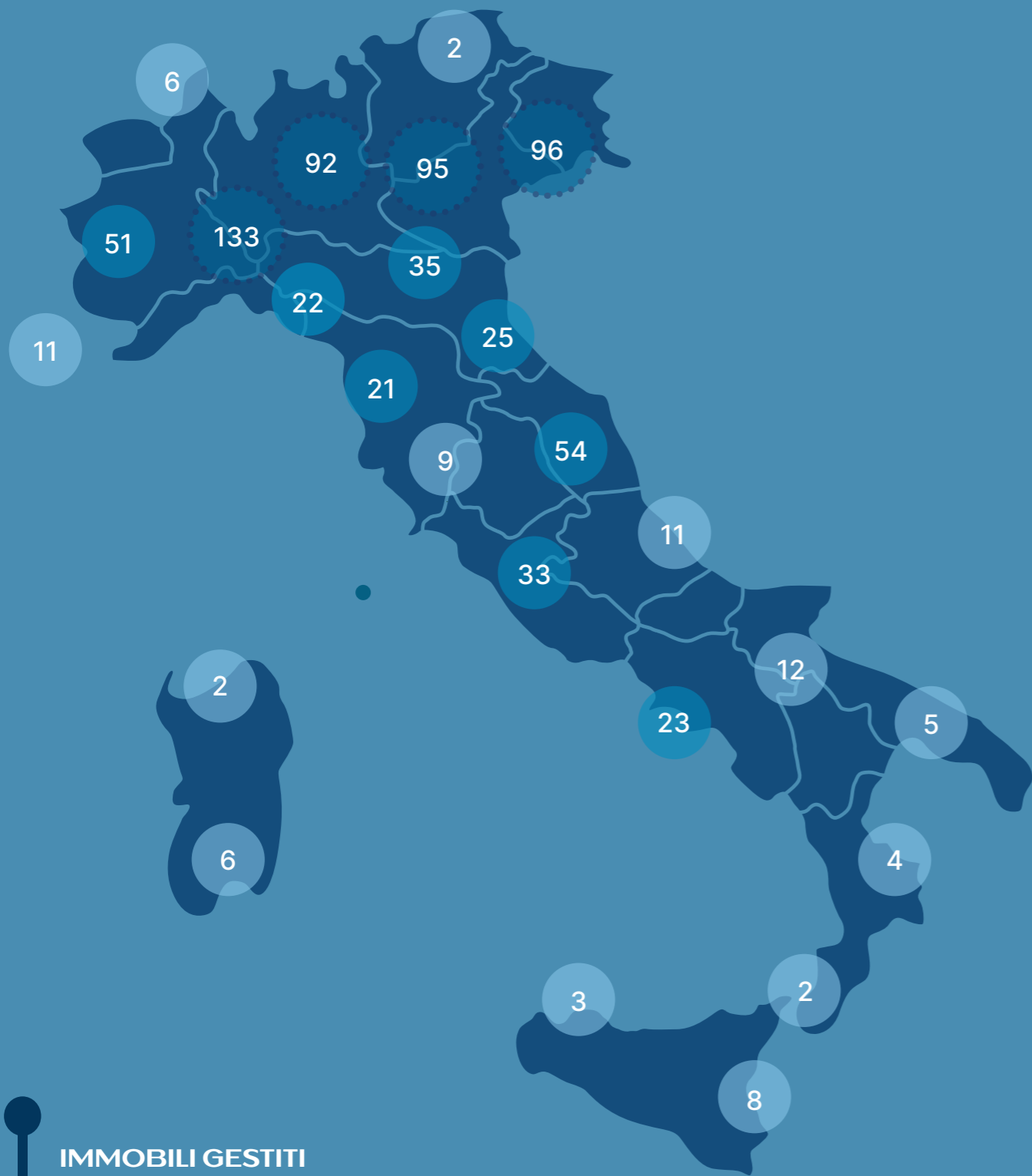
IMMOBILI GESTITI AD OGGI